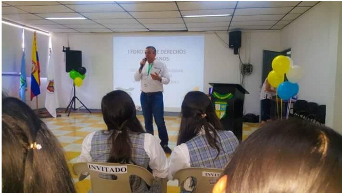
EL PERSONERO MUNICIPAL DICTO EN EL COLEGIO DIOCESANO MONSEÑOR BALTASAR ALVAREZ RESTREPO EL "PRIMER FORO DE DERECHOS HUMANOS"