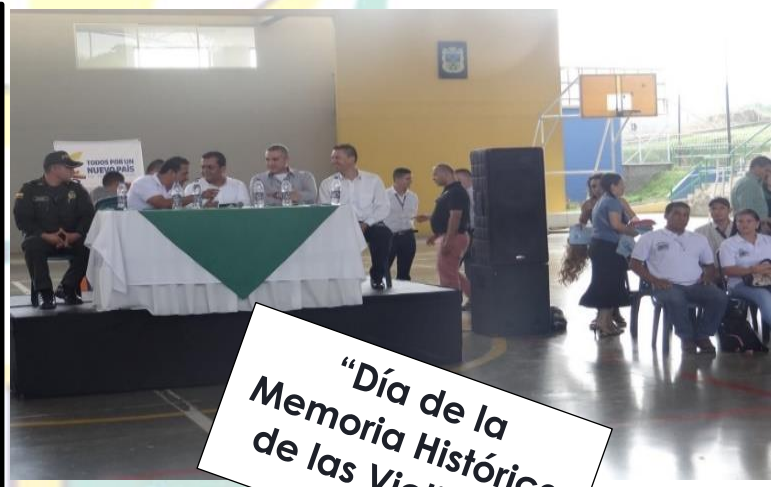
“Día de la Memoria Histórica de las Víctimas”