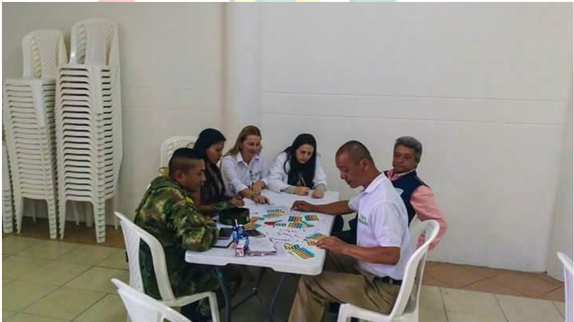
PARTICIPACION EN LA ELECCION DE LOS REPRESENTANTES MUNICIPALES A LA MESA DE PARTICIPACION EFECTIVA DE VICTIMAS DEL CONFLICTO ARMADO.